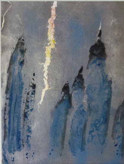
eine Minute danach, Acryl auf Leinwand, 30 x 40 cm, J.A.C