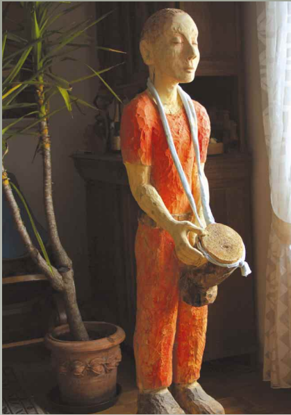
Der Wächter, Pappelholz - 130 x 50 x 30 cm, 2009, Ilse