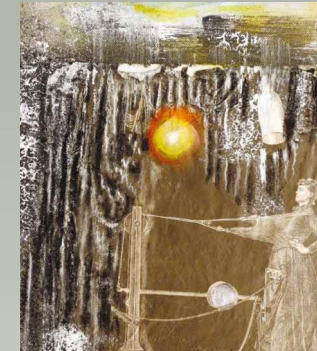
Rebirthing II - Collage auf Leinwand