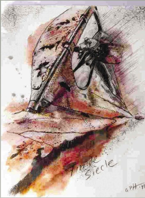
Schiffsfriedhof - Detail Pastellkreide auf "Britannia"