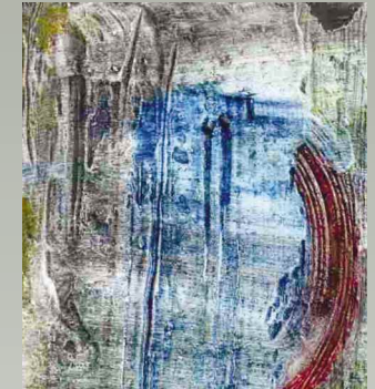
Moonrising - Champagnerkreide auf Holzplatte

EINZELAUSSTELLUNG EXPOSITION INDIVIDUELLE